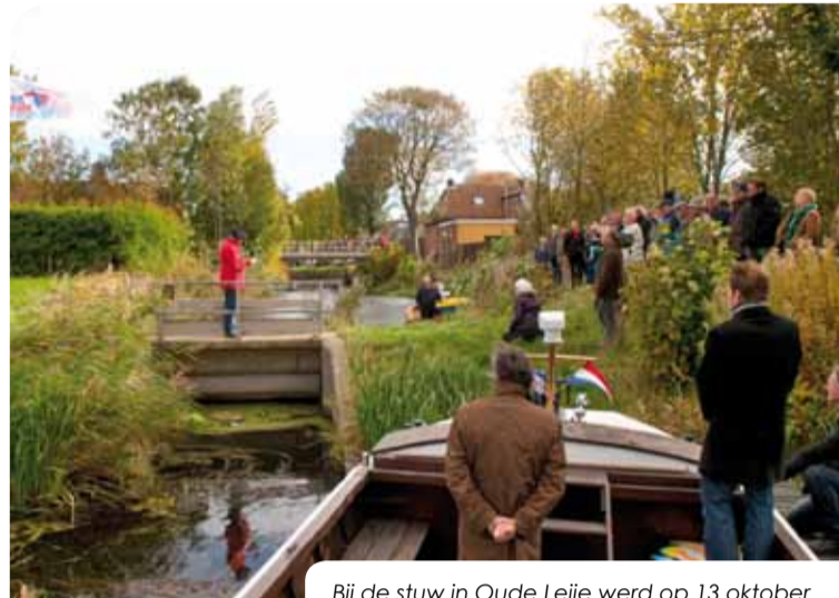
Bij de stuw in Oude Leije werd op 13 oktober bekendgemaakt wie de sluisen in Oude Leije en Wier zal gaan aanleggen.

In 2009 zijn, onder andere op het Bildt, een aantal bruggen verhoogd. In 2010 laat de organisatie sluisen aanleggen in