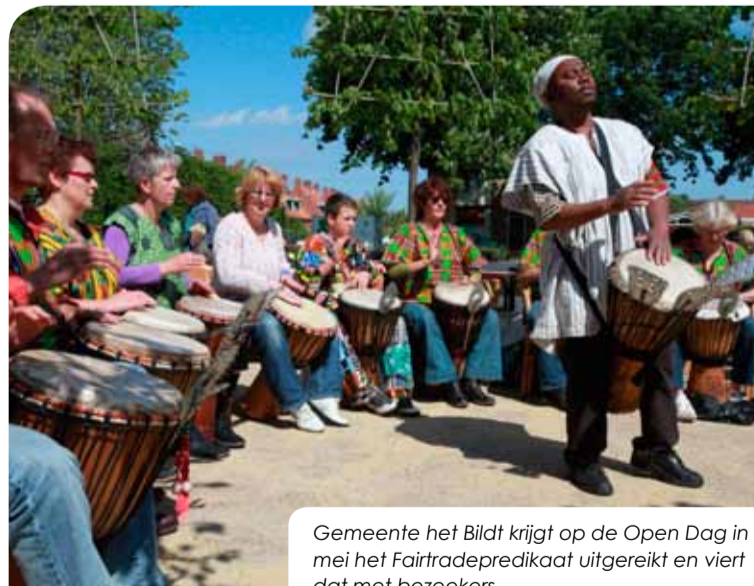
Gemeente het Bildt krijgt op de Open Dag in mei het Fairtradepredikaat uitgereikt en viert dat met bezoekers

Gemeente het Bildt is in mei bekroond tot eerste Friese Fairtradegemeente en is daarmee ook de derde Fairtradegemeente van Nederland. Daarnaast doet gemeente het Bildt mee aan de millenniumcampagne. Dit betekent dat de gemeente van 2009 tot en met 2015 actief bijdraagt aan de millenniumdoelen. De millenniumdoelen willen de honger in de wereld verminderen, onderwijs, goede (medische) zorg en gelijke rechten voor iedereen organiseren, eerlijke handel stimuleren en zorgen voor een duurzaam leefmilieu. Gemeente het Bildt werkt op drie manieren aan twee van de millenniumdoelen: